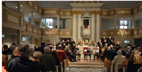
Festgottesdienst zur Wiedereröffnung M. Nieke

Die ursprünglich für Dezember 2024 geplante Wiedereröffnung musste aufgrund Verzögerungen im Bauablauf und nicht eingeplanter Maßnahmen auf Mai 2025 verschoben werden. Doch auch dieser Termin stand recht bald auf der Kippe. Dennoch konnte Mitte Mai 2025 die vorläufige Wiedereröffnung der (noch nicht ganz fertigen) Kirche mit einem großen Festgottesdienst mit Sup. Feydt und einer anschließenden Festwoche gefeiert werden. Über die Sommerferien wurde die Kirche wieder geschlossen und weitergebaut. Die restlichen Arbeiten werden noch bis Herbst andauern.