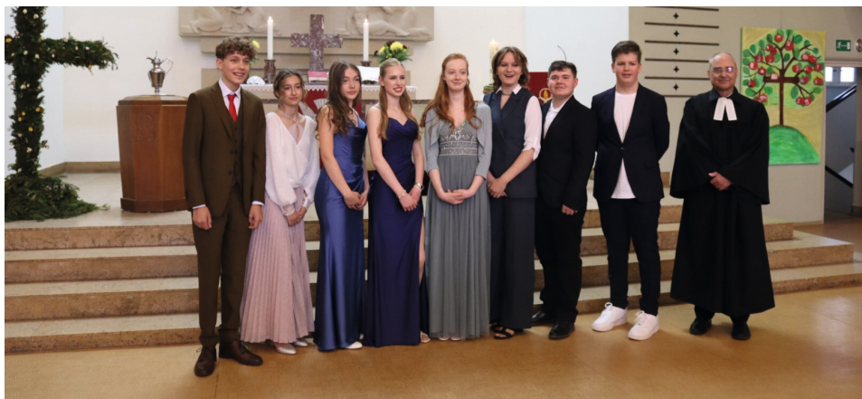
Unsere Konfirmanden (Namen siehe Freud und Leid)

Am Reformationstag findet das Kirchen-café 16.00 Uhr vor der Veranstaltung statt.